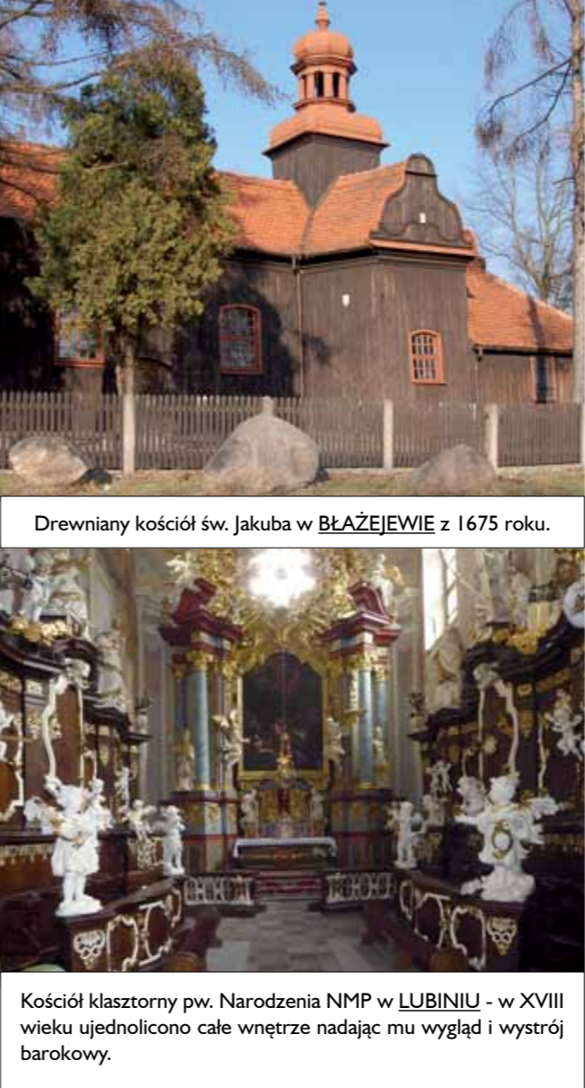
Drewniany kościół św. Jakuba w BŁAŻEJEWIE z 1675 roku.

Klasztor w LUBINIU - „Perła wśród niziny” – to określenie zabytkowego zespołu opactwa lubińskiego, przechowującego w swych murach echo sprzed dziewięciu wieków. Położenie opactwa sprawia, że smukła i strzelista wieża kościelna ozdobiona podwójnym przeswitem jest z daleka widoczna w całej okolicy.